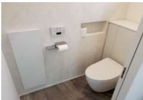
水まわり機器 工事・修理システム