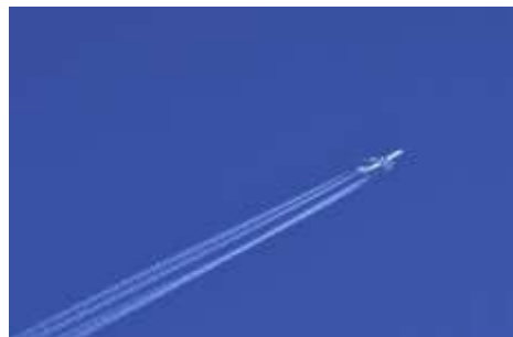
旅行 通信販売 システム