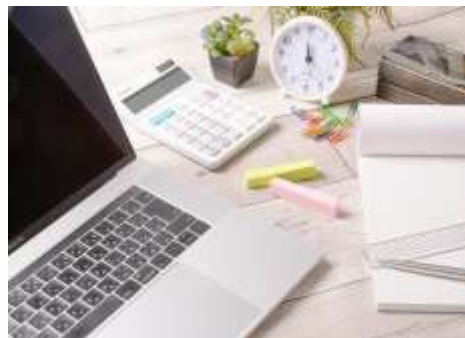
ローコード ツール開発