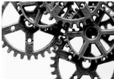
製造業 実績収集システム