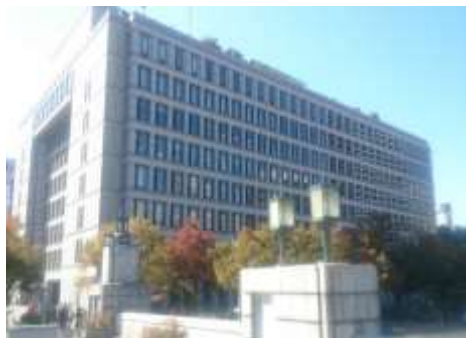
自治体 人事給与システム