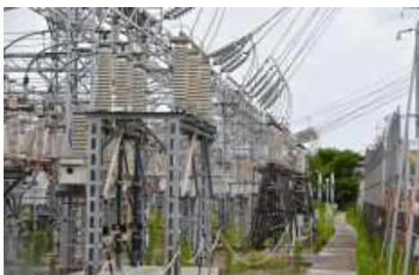
電力・ガス 関連システム