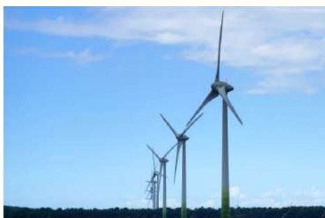
電力・ガス・通信 事業