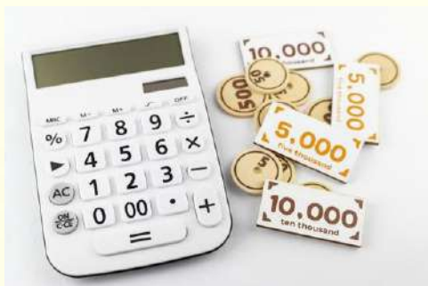
金融 銀行・保険・証券