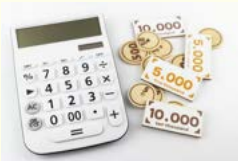
金融 銀行・保険・証券