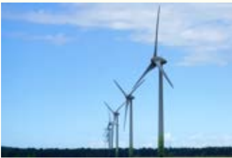
電力・ガス・通信 事業